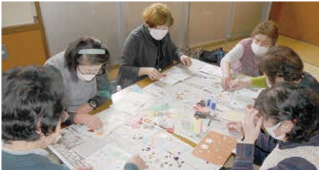
集中して取組んでおります。