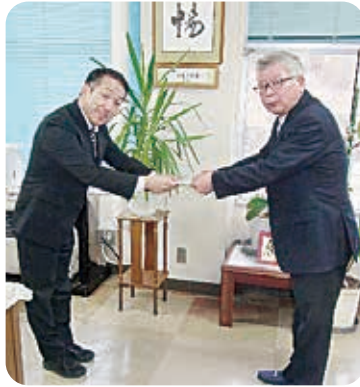
ご卒業おめでとうございます。

今年の冬は2月に雪が降らずに3月になってから雪が降り、気温が上がらずに寒い日が続いておりますが、少しずつ気温が上がってきています。まだ寒い日がありますのでお体に気を付けてください。 さて、今回も歳末たすけあい運動募金を利用し、各地区及び福祉施設で実施されました「地域ふれあい事業」の報告を掲載しました。工夫して実施していただいていることが伺えます。大変感謝いたします。ありがとうございました。