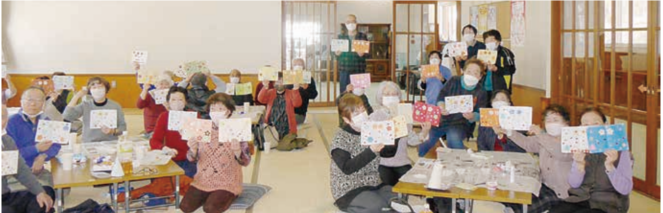
上手にできました。