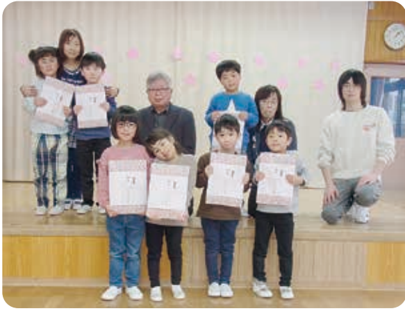
湯野上保育所卒園児の皆さん