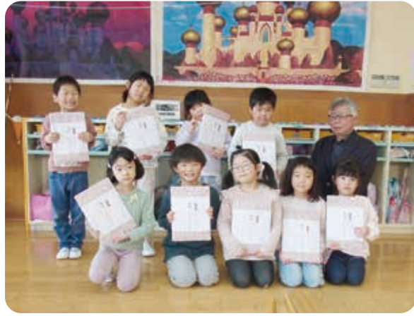
しもごう保育所卒園児の皆さん