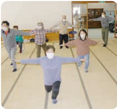
みんなで体をほぐします。