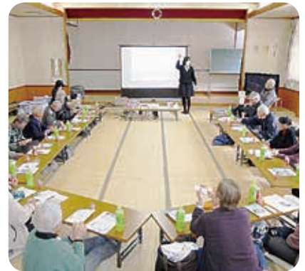
健康の話を聞きました(^.^)