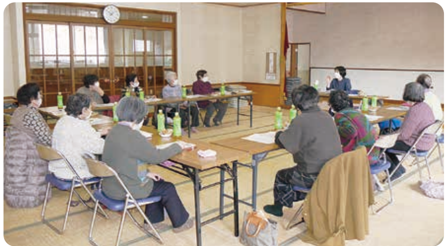
健康で暮らすためのお話を聞いています。