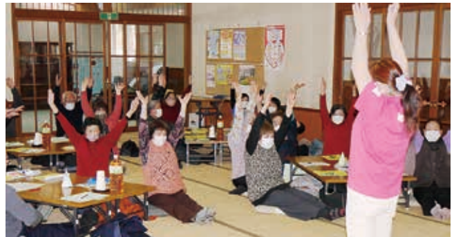
みんなで体をほぐします。