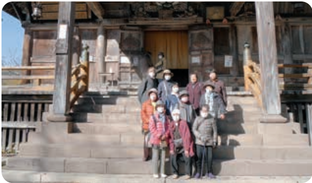
園蔵寺で記念写真