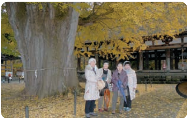
新宮熊野神社で記念写真

10月の活動は福祉バスを利用し、栃木県那須町方面へ行き、那須フラワーワールド、相田みつをギャラリーを見学しました。