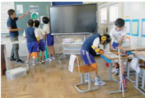
名前がうまく書けない！見えにくい！