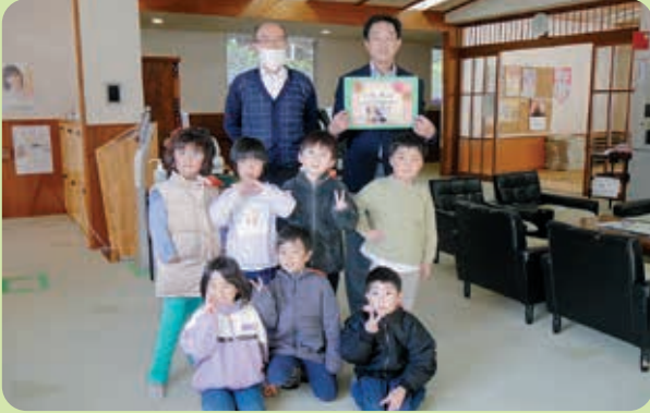
お仕事頑張ってください(^o^)

11月21日、湯野上保育所(渡部薫所長)「そら組」園児7名は、勤労感謝の日にちなみ、下郷町老人福祉センターを訪問しました。