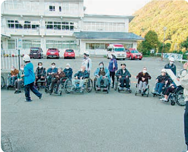
皆さん避難しました。

10月19日消防署下郷出張所の協力のもと、下郷町老人福祉センター、下郷町デイサービスセンターにおいて防災訓練を行いました。老人福祉センター厨房から出火したことを想定し、下郷町デイサービス利用者の皆様も参加して避難訓練が行われました。その後、消防署員より消火器の使い方の説明を受けた後、消火器を使った消火訓練に取り組みました。火災時の心構えや避難誘導についても指導していただきました。