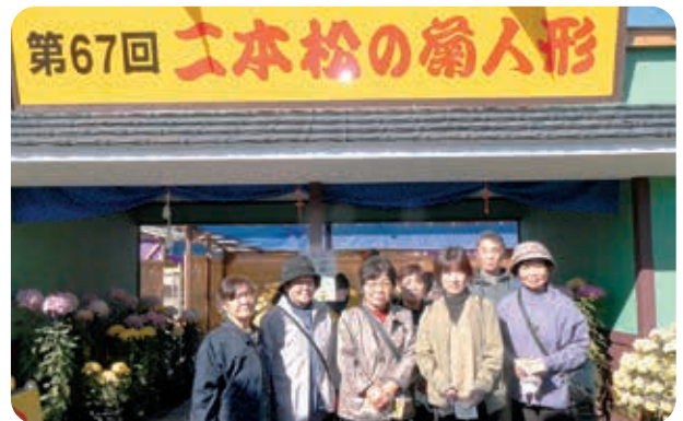
二本松菊人形会場で記念写真

11月の活動は福祉バスを利用し、喜多方市方面へ行き、喜多方新宮熊野神社を拝観しました。