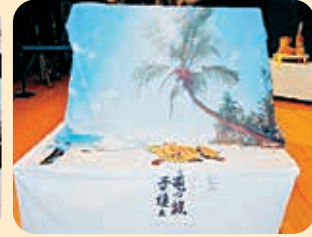
銀賞 星 宏侑様