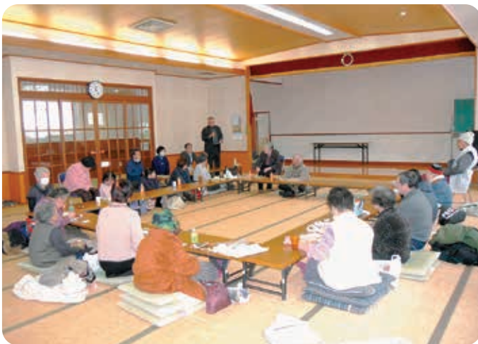
意見や感想をお願いします。

町内の4社会福祉法人で実施している買い物支援サービスが12月18日で今年度の最終日となりました。今年度のサービスを利用していただいた利用者様及び各法人の担当者が一堂に会し食事会を開催しました。参加された皆様は、自分で買ってきた弁当を食べた後、今年度の買い物支援サービスについての意見や感想を述べられました。