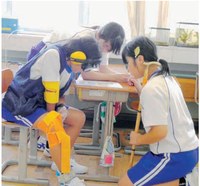
なんて書いてあるかわかる？