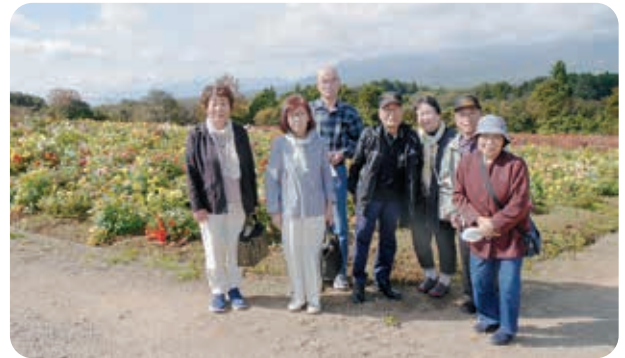
那須フラワーワールドで記念写真

11月の活動は福祉バスを利用し、柳津町方面へ行き、福満虚空蔵菩薩霊巖山園蔵寺を参拝しました。