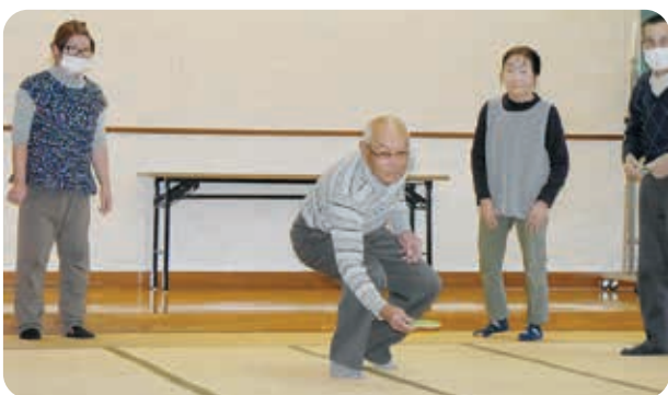
よーくねらいを定めて！

11月の活動は福祉バスを利用し、二本松市方面へ行き、第67回二本松菊人形、智恵子の生家智恵子記念館、安達ヶ原ふる里村を見学しました。