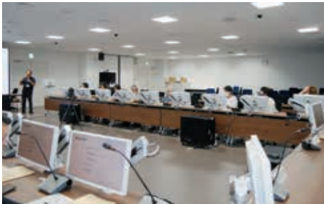
防災クイズ解けるかな。