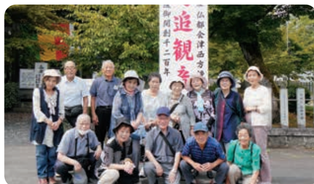
鳥追観音で記念の1枚

9月の活動は福祉バスを利用し、柳津町にある福満虚空蔵尊や立木観音などを拝観しました。