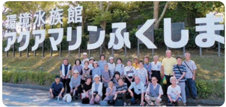
アクアマリンふくしまで記念撮影

8月22日に一人暮らし高齢者を対象とした親睦旅行が行われました。今年度はいわき市小名浜方面を計画し、28名の参加者がありました。当日は快晴で、参加者の皆さんは元気で楽しい旅行日和となりました。小名浜では「アクアマリンふくしま」を見学後、「いわき・ら・ら・ミュウ」で昼食をとり、買い物も楽しみました。帰りのバスの中では参加者同士が次の再会を約束するなど、会話をはずませていました。