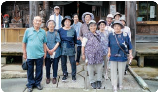
中田観音で記念の1枚