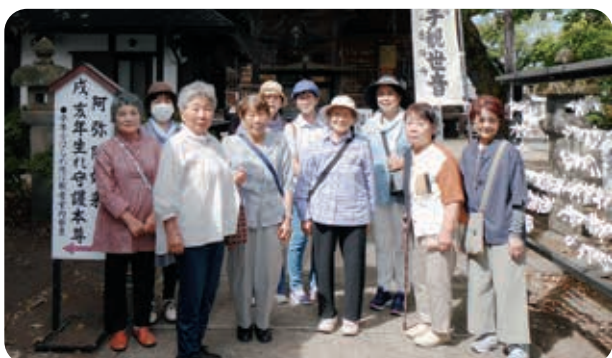
立木観音で記念の1枚

7月の活動は福祉バスを利用し、柳津町であわまんじゅうづくり体験や金山町にある「東北電力奥会津水力館みお里」を見学しました。