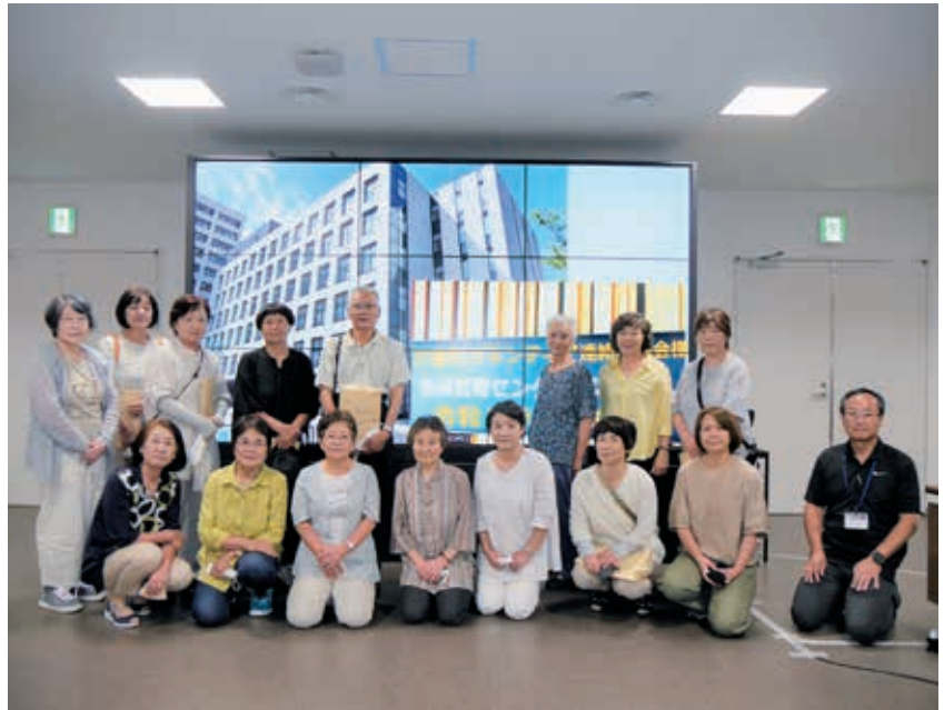
福島県危機管理センターで記念写真