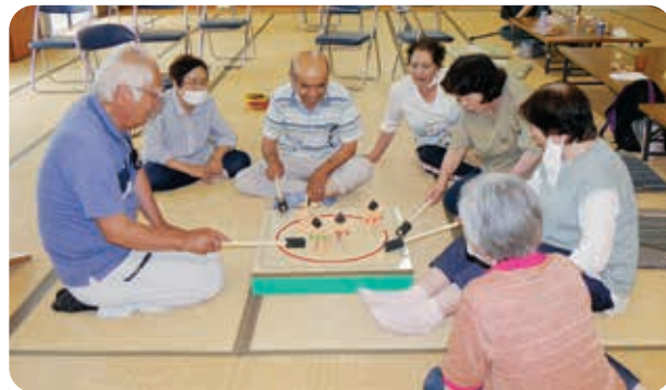
はっけよい、のこった。どっちが強い？(^。^)

7月の活動は福祉バスを利用し、中田観音、立木観音、鳥追観音の会津ころり三観音を拝観しました。