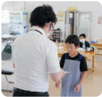
修了証をいただきました。