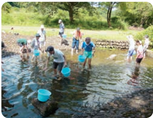
鱒がなかなか捕まらない～！