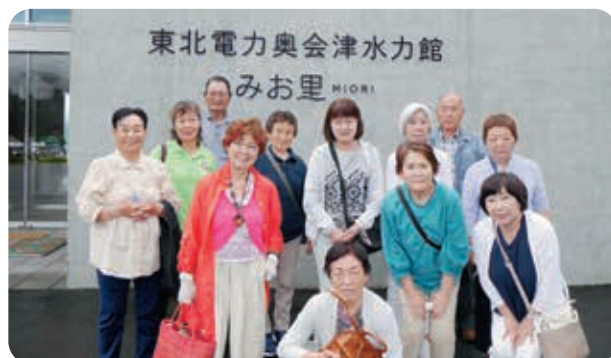
奥会津水力館みお里で記念の1枚

7月の活動はひし巻・笹団子作りを行いました。もち米1Kg分のひし巻と、だんご粉2kg分の笹団子を作り、お昼の会食時にいただきました。