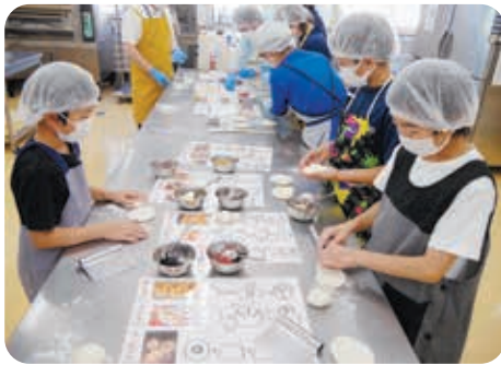
お手本を見ながら頑張っています。