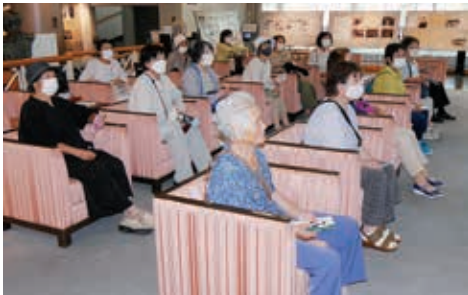
懐かしい歌が聞こえてきました。 (古関裕而記念館にて)