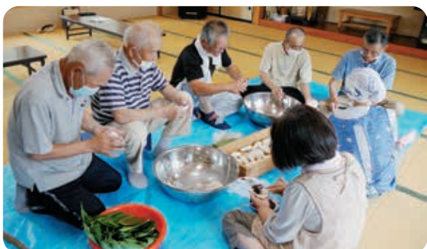
皆さんじゃょうずに包んでいます。(^^)v

7月活動は福祉バスを利用し、老人福祉センターで午前中は輪投げや太鼓相撲などのレクリエーションを行い、午後は温泉入浴を楽しみ、のんびり過ごしました。