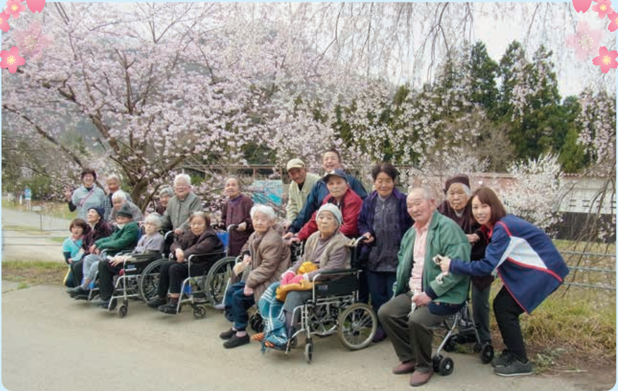
4月6日木曜日利用の皆様です。

4月6日～12日にかけて、下郷町老人デイサービスセンターをご利用の皆様は、春恒例のお花見ドライブを実施しました。今年は桜の開花が早まり、いつもより早い時期のお花見ドライブになりました。コロナウィルスの影響もありましたが、今年も感染に注意しながら車から降りて花見を楽しむことが出来ました。「天気が良くて桜もきれいでした。」などお互いに感想が述べられました。