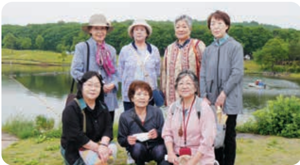
レジーナの森で記念の1枚

6月の活動は福祉バスを利用し栃木県那須町にある那須フラワーワールドやお菓子の城を見学しました。