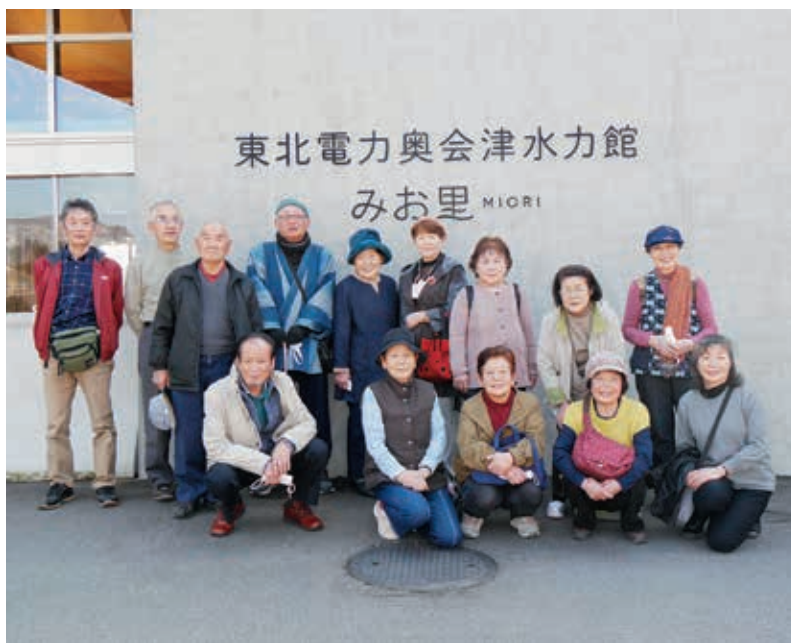
奥会津水力館みお里で記念の1枚