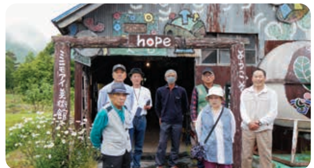
ミニモアイ美術館で記念の1枚

6月の活動は福祉バスを利用し会津若松市内にある院内御廟や磐梯町にある史跡慧日寺・資料館を見学し、また、猪苗代町にある天鏡台・昭和の森公園を散策しました。