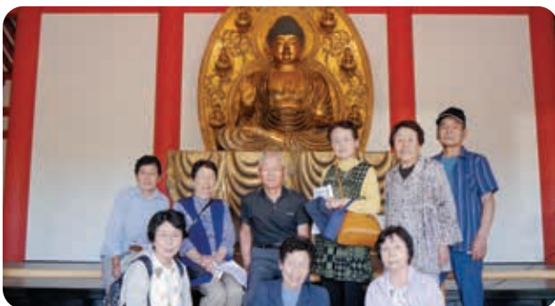
史跡慧日寺で記念の1枚

6月の活動は福祉バスを利用し、御蔵入33観音のうち8番札所、9番札所、会津ころり三観音を拝観しました。