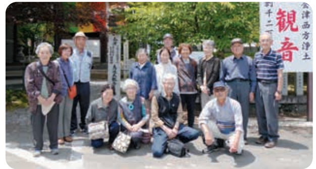
鳥追観音で記念の1枚

6月の活動は福祉バスを利用し、須賀川市にある藤沼湖、天栄村にあるブリティッシュヒルズやレジーナの森を見学しました。