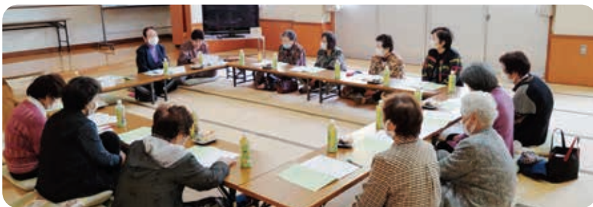
よく話を聞いて決めています。(..)φメモメモ