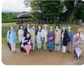
那須フラワーワールドで記念の1枚

5月の活動は福祉バスを利用し会津柳津町にある斎藤清美術館、只見駅及び只見川 (夢幻峡)を見学しました。