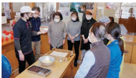
説明をよく聞いています。