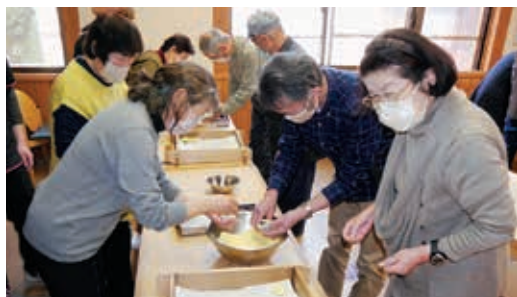
みんなで作ります。上手くできるかな？