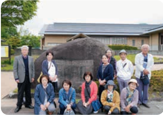
斎藤清美術館で記念の1枚