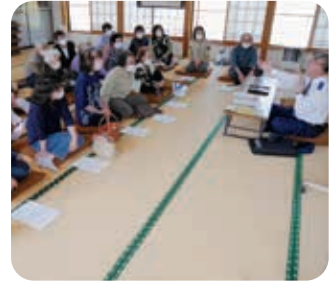
熱心に話を聞きます。