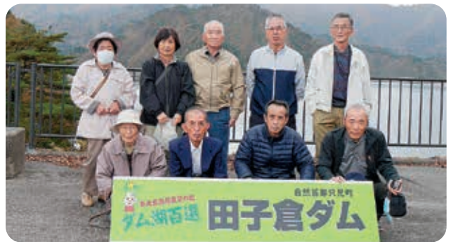
田子倉ダムで記念の1枚

福祉バスを利用し、只見町の田子倉ダムと只見ブナと川のミュージアム及びふるさと館田子倉等を見学しました。