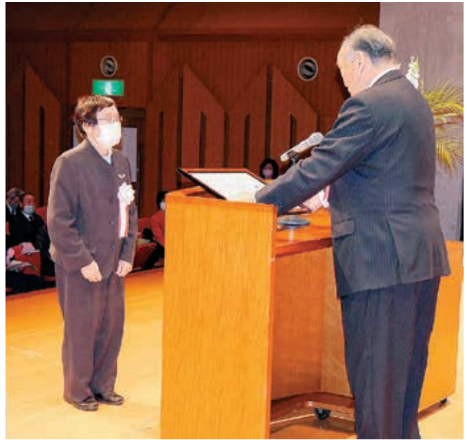
受賞おめでとうございます。