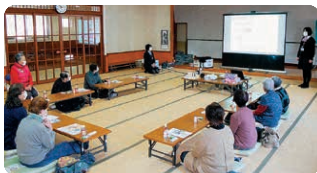
おなかの大切さについて熱心に聞いています(^。^)

福祉バスを利用し、会津三十三観音第18番札所滝沢観音を拝観しました。その後、道の駅ばんだいで昼食を摂りました。