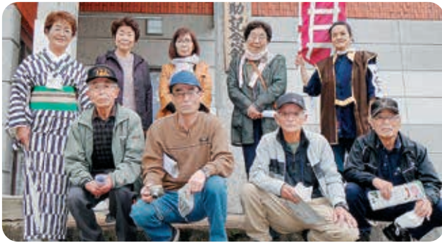
河井継之助記念館で記念の1枚