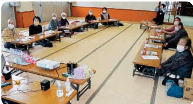
さまざまな健康情報を熱心に聞いています(@_@。