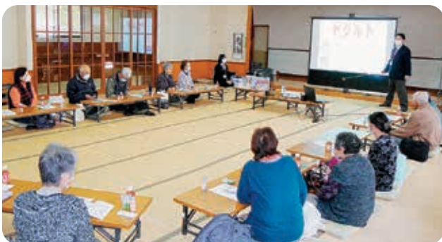
第2の脳と言われる“腸”についての説明(©_©);

福祉バスを利用し、只見町の只見ブナと川のミュージアムと田子倉ダム及び水とエネルギーの只見展示館を見学しました。