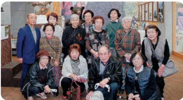
只見ブナと川のミュージアムで記念の1枚

福祉バスを利用し、老人福祉センターでみんなの体操で体を温め、ゲーム等を行いました。